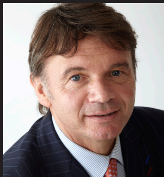
FC琉球 総監督 フィリップ・トルシエ

フランス出身のサッカー監督。 1998年～2002年まで日本サッカー協会の要請を受け、日本代表監督を務めた事で知られる。アフリカで実績を上げ、ブルキナファソにて白い呪術師(White Witchdoctor)の異名で知られている。